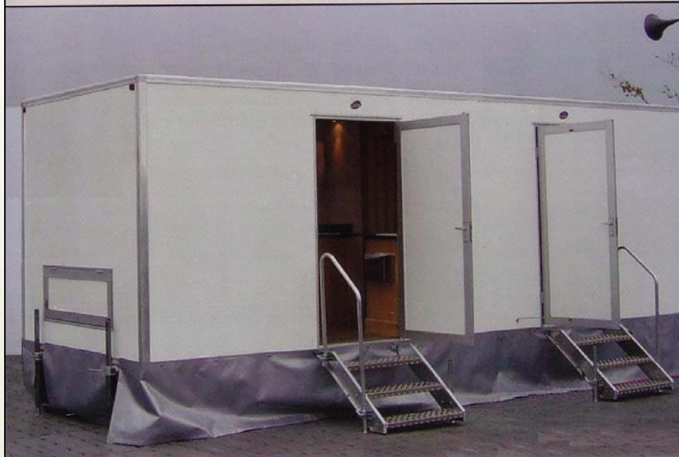
Detalle de interiores.