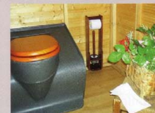
Detalle de interiores.